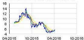
NOVAVAX, INC. - COMMON ST Historic

david.schull@russopartnersllc.com todd.davenport@russopartnersllc.com 212-845-4271