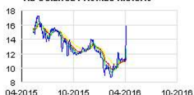
AB SCIENCE PROMES Historic

AB Science - Financial Communication & Media Relations investors@ab-science.com